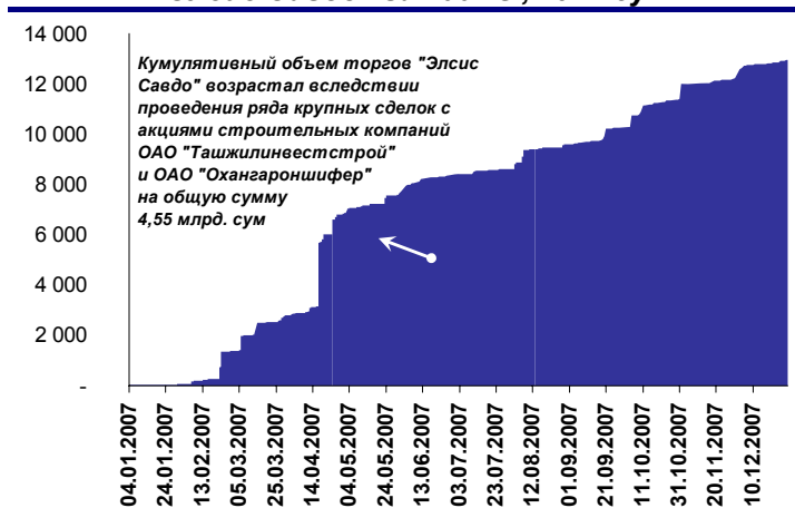
Диаграмма №1: Кумулятивный оборот ЭСВТ «Элсис Савдо» за 2007 г., млн. сум