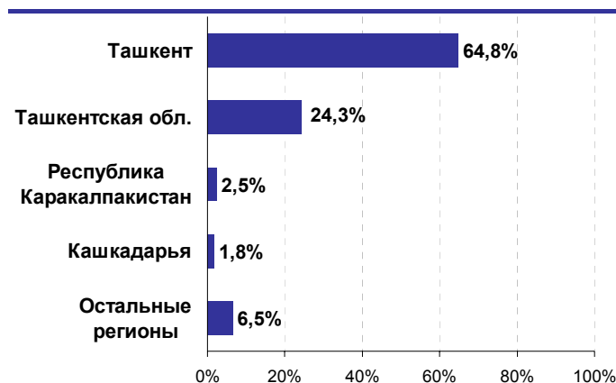
Диаграмма №4: Региональная структура торгов ЭСВТ «Элсис Савдо» за 2007 г.

Источник: ЭСВТ «Элсис Савдо» Расчеты: Avesta Investment Group