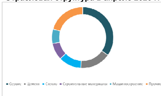
Отраслевая структура в апреле 2020 г.